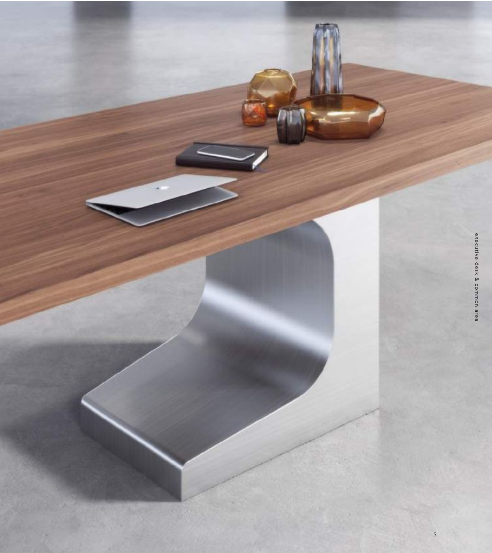
executive desk & common area